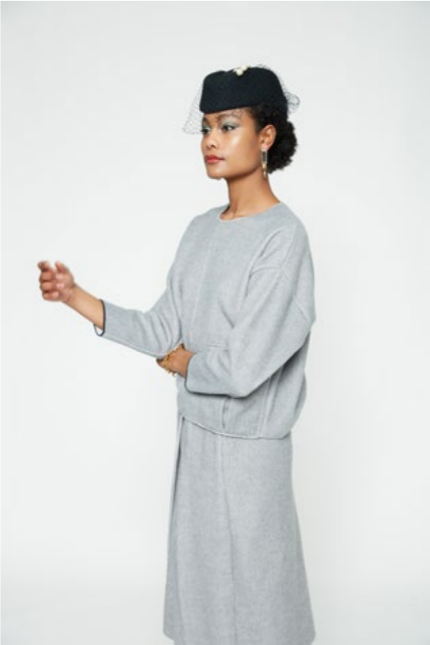
Maglia: NW114B Gonna: NW404B