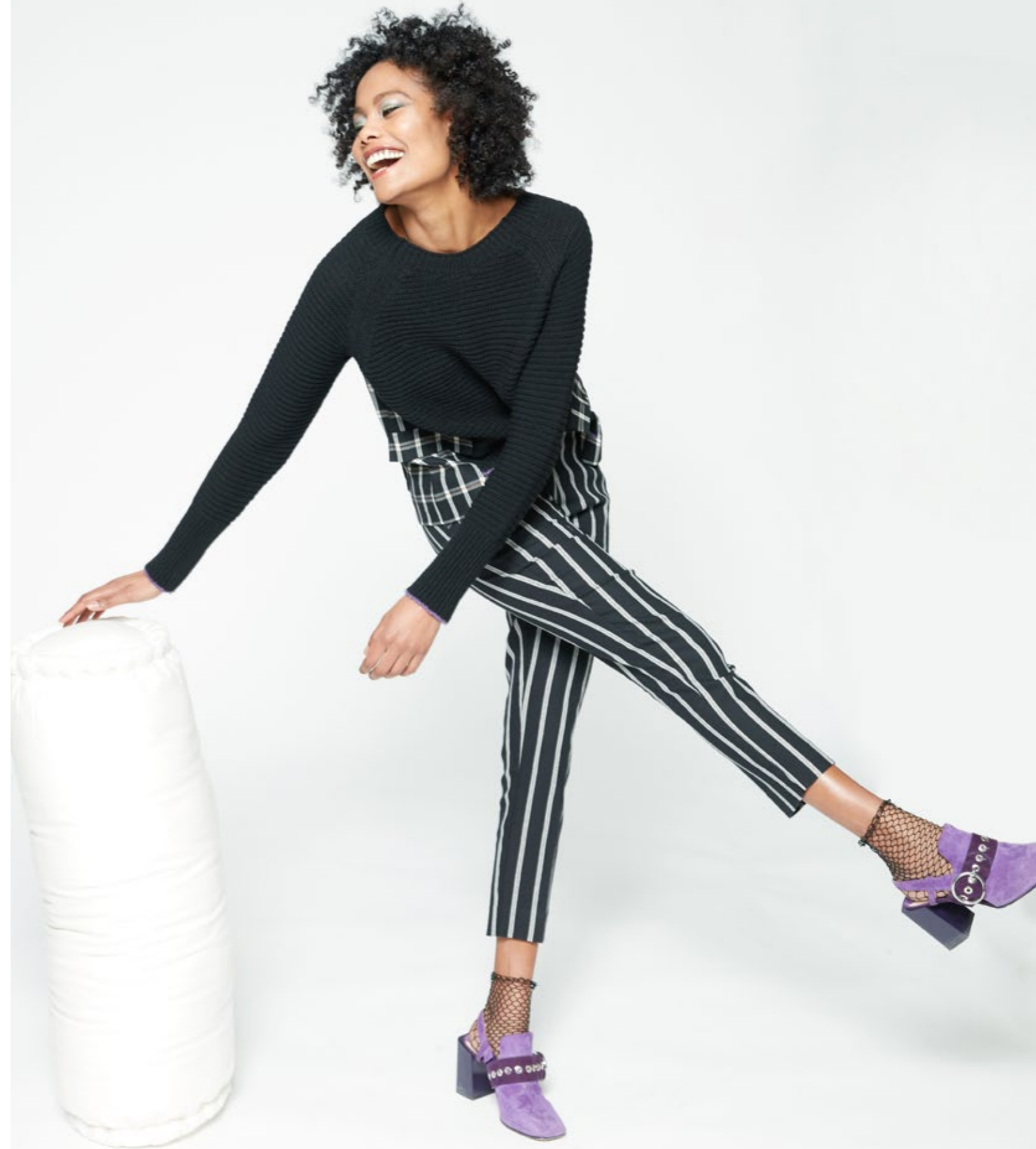
Maglia: NW110B Pantalone: NW321C