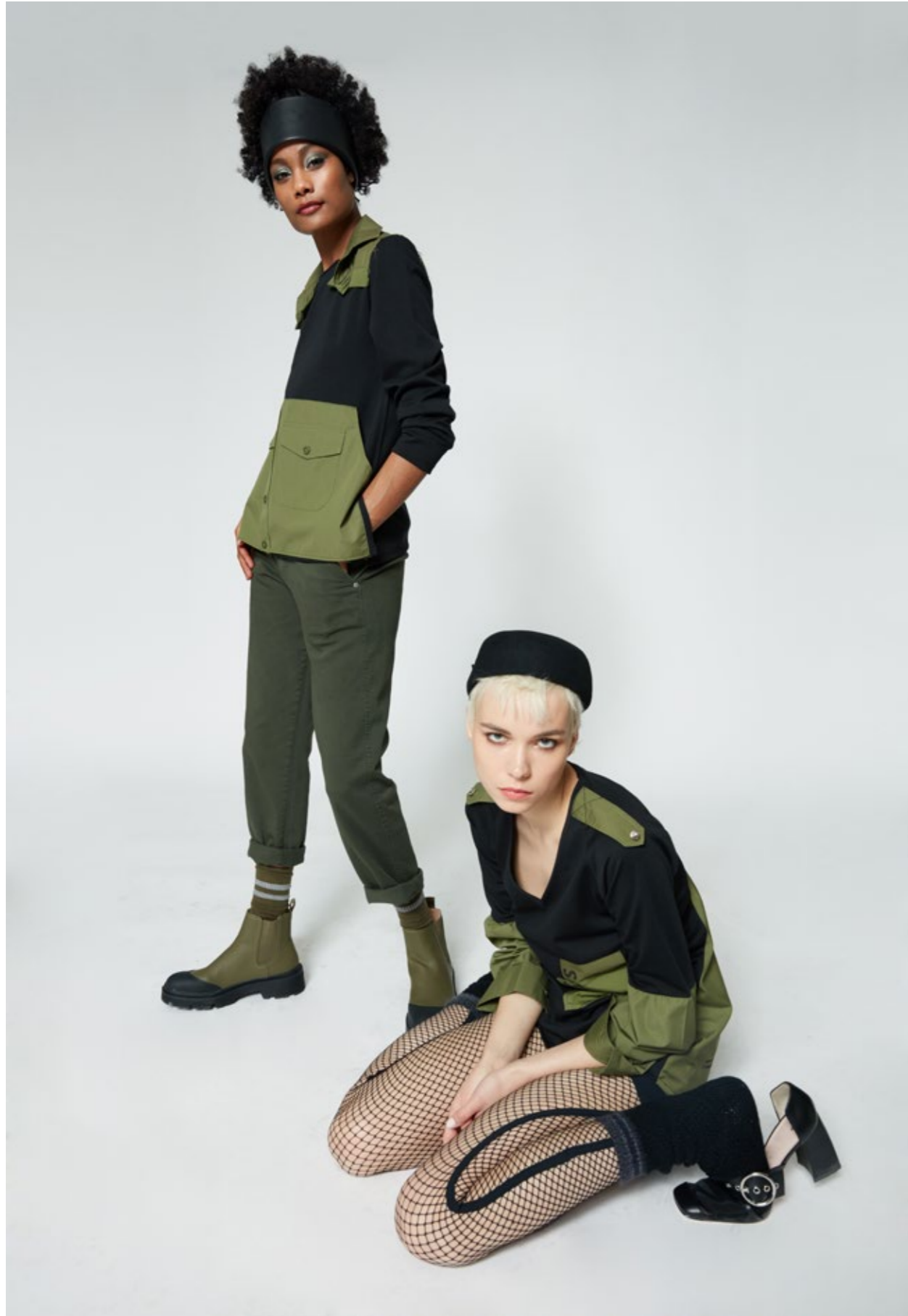
Maglia: NW116M Pantalone: NW312J