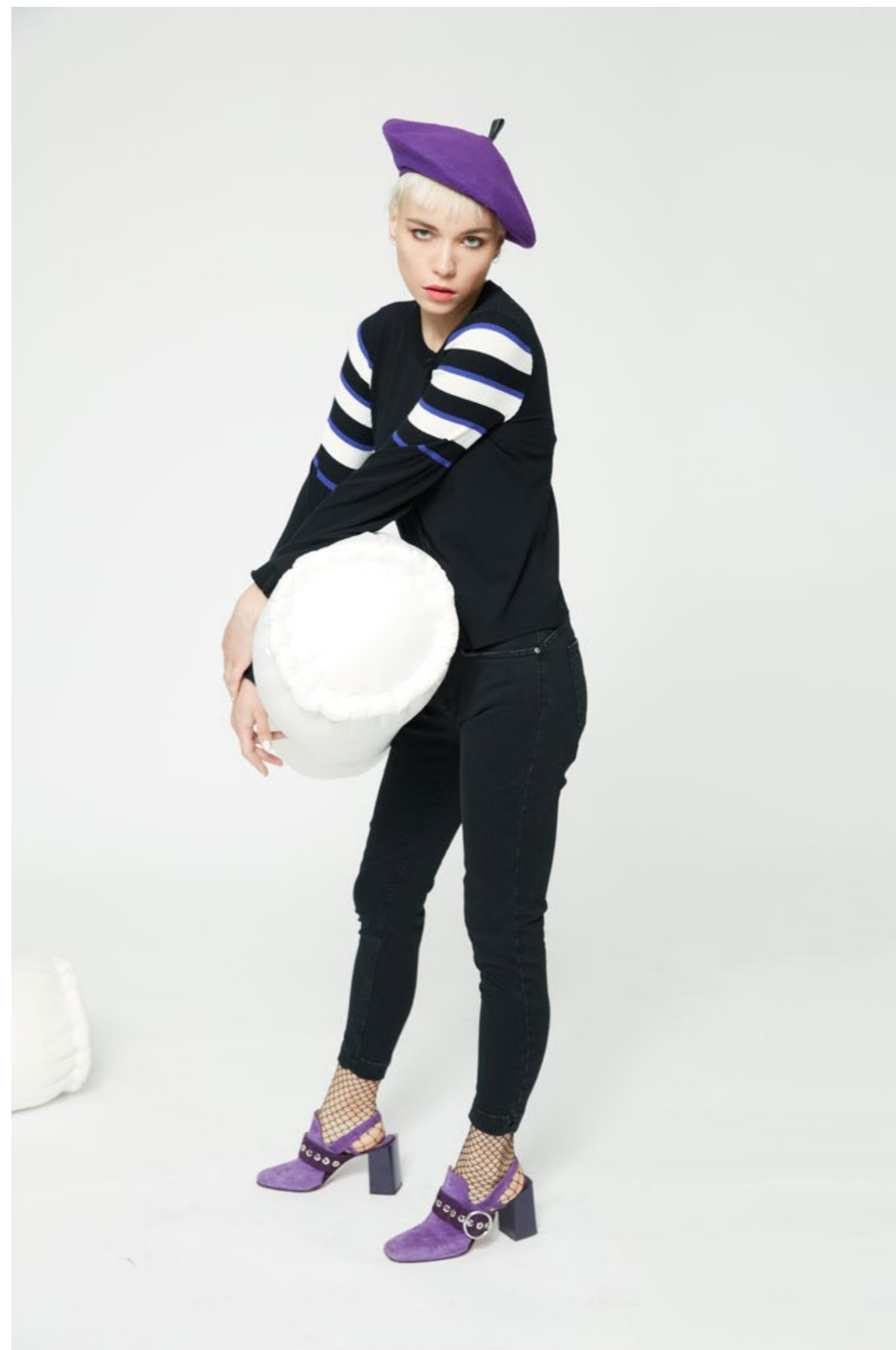
Golfino: NW209V Jeans: NW313J