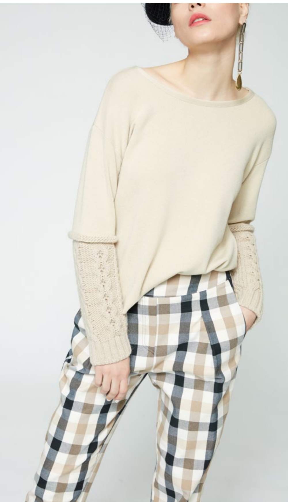
Maglia: NW105V Pantalone: NW319C