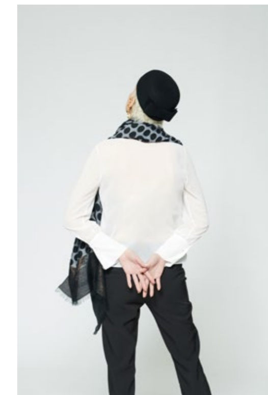
Camicia: NW507C Pantalone: NW314C Sciarpa: NW701P