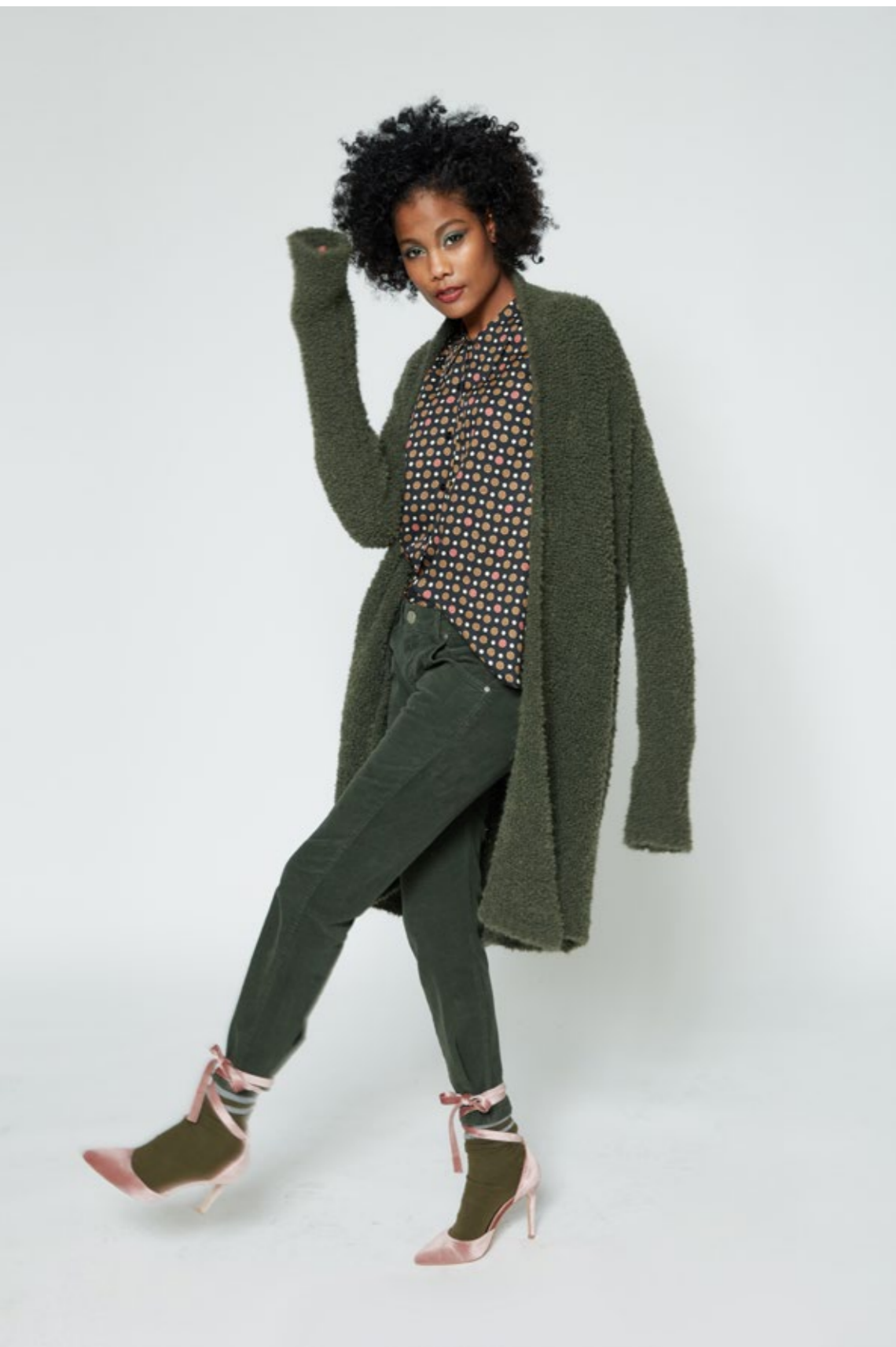
Cardigan: NW214B Camicia: NW508FANT Pantalone: NW300BIS