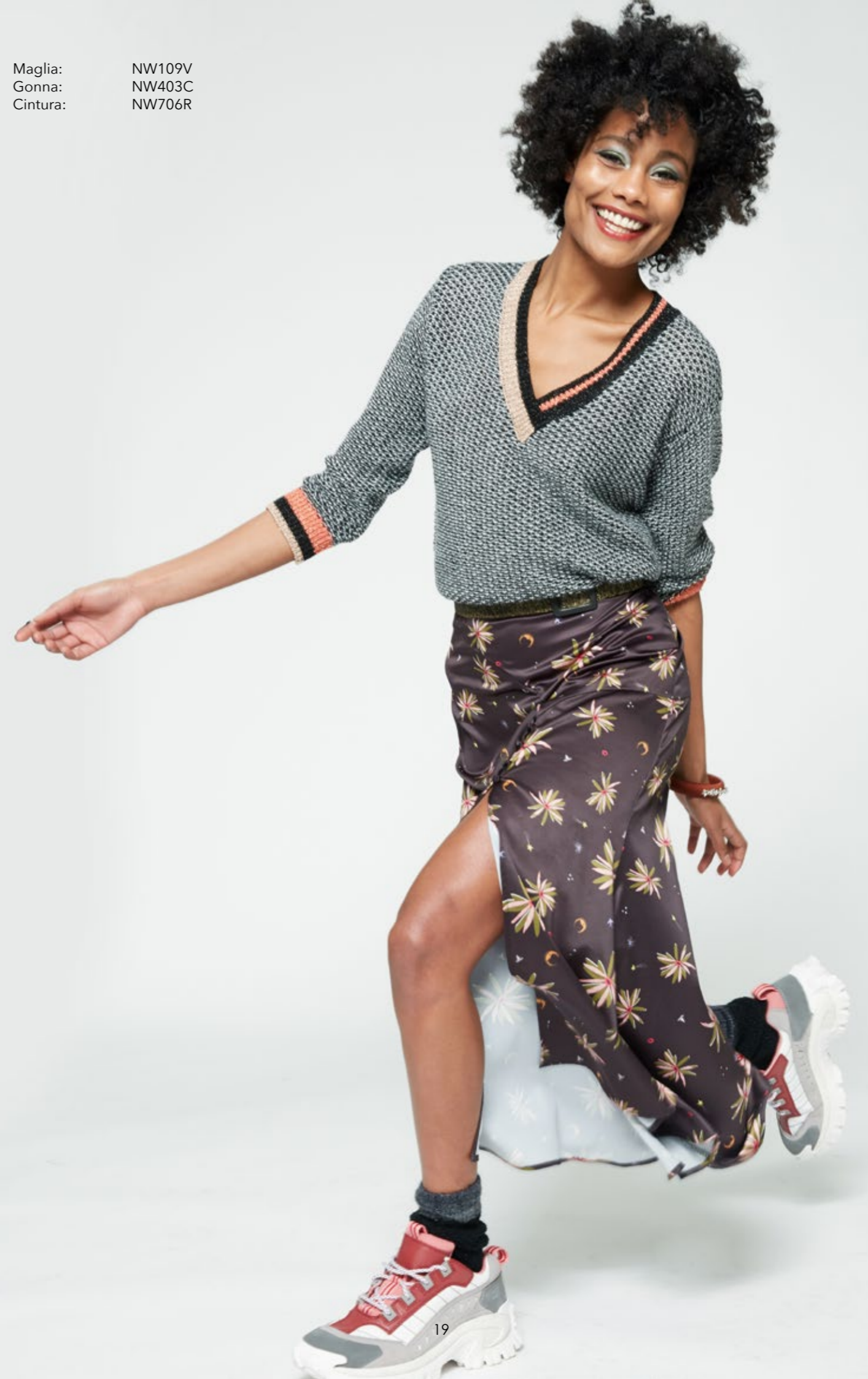
Maglia: NW109V Gonna: NW403C Cintura: NW706R