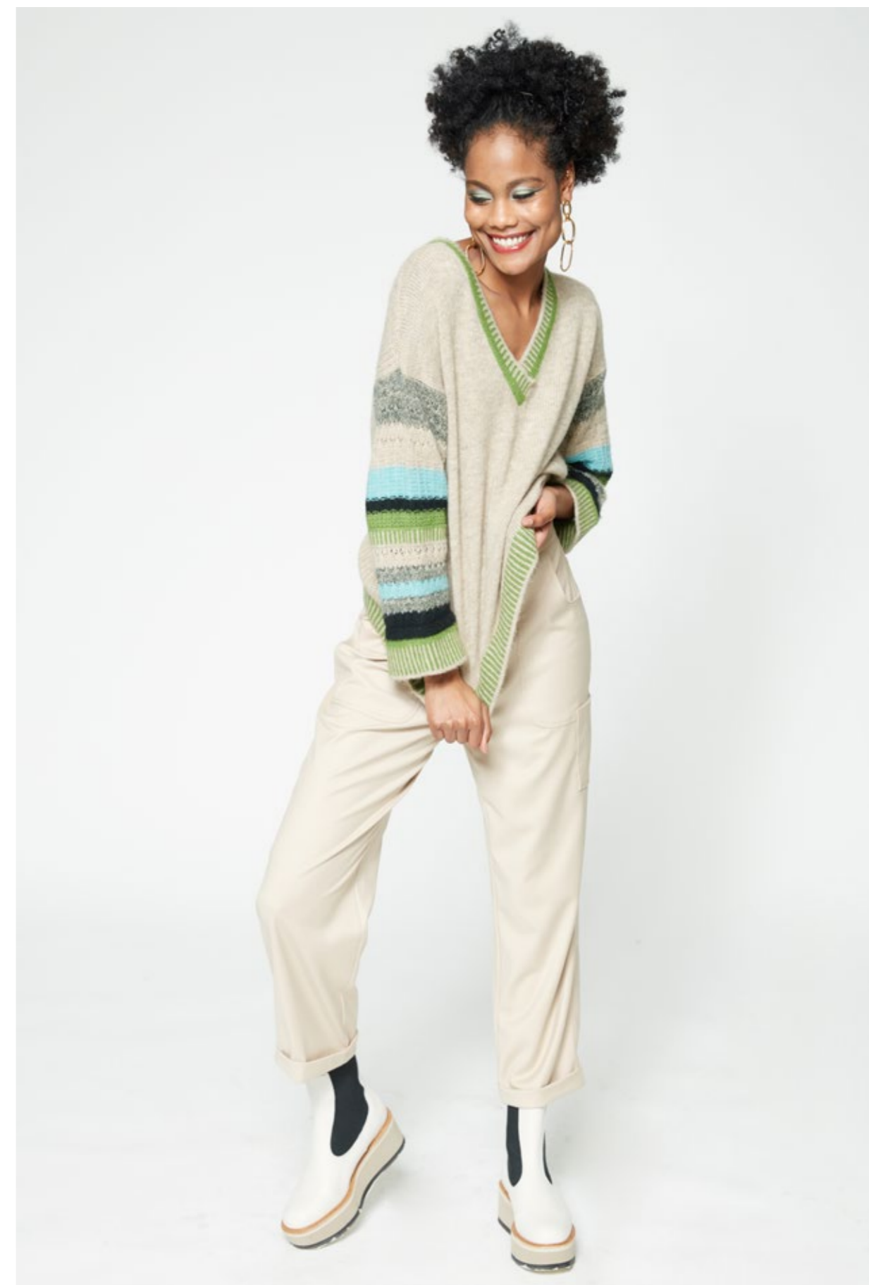
Maglia: NW102V Pantalone: NW309N