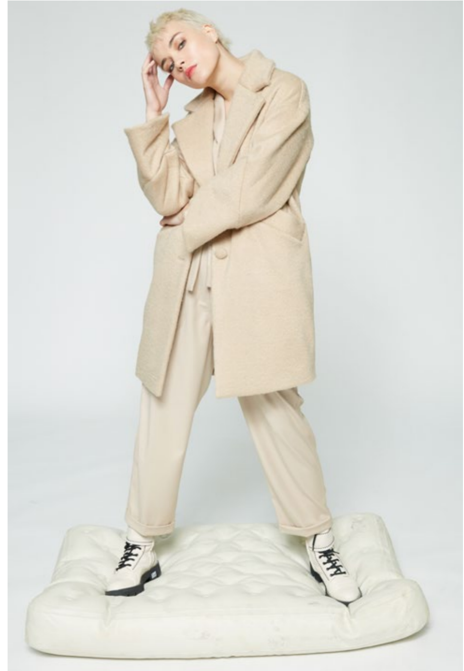
Cappotto: NW218C Giacca: NW202N Pantalone: NW309N