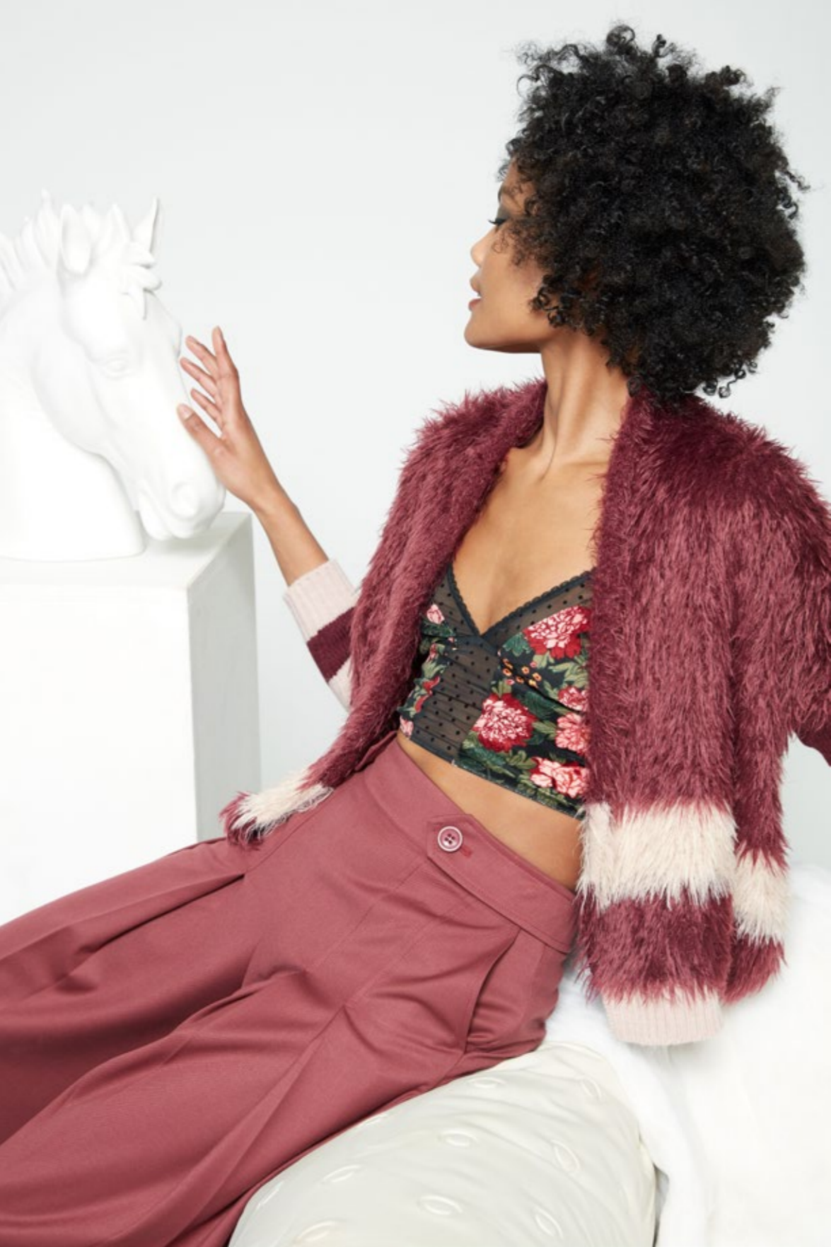
Cardigan: NW210V Pantalone: NW318C