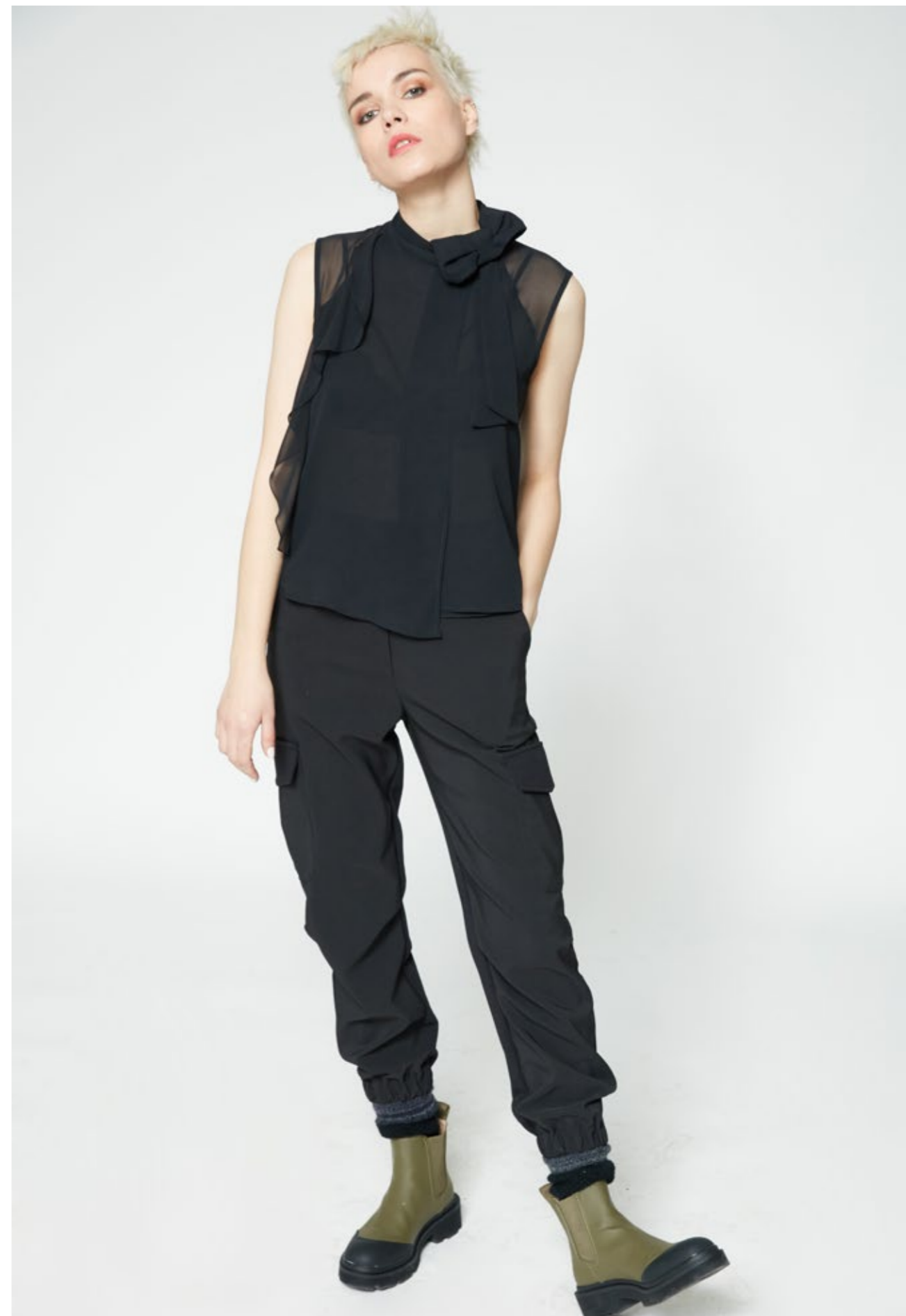
Camicia: NW506C Pantalone: NW307N