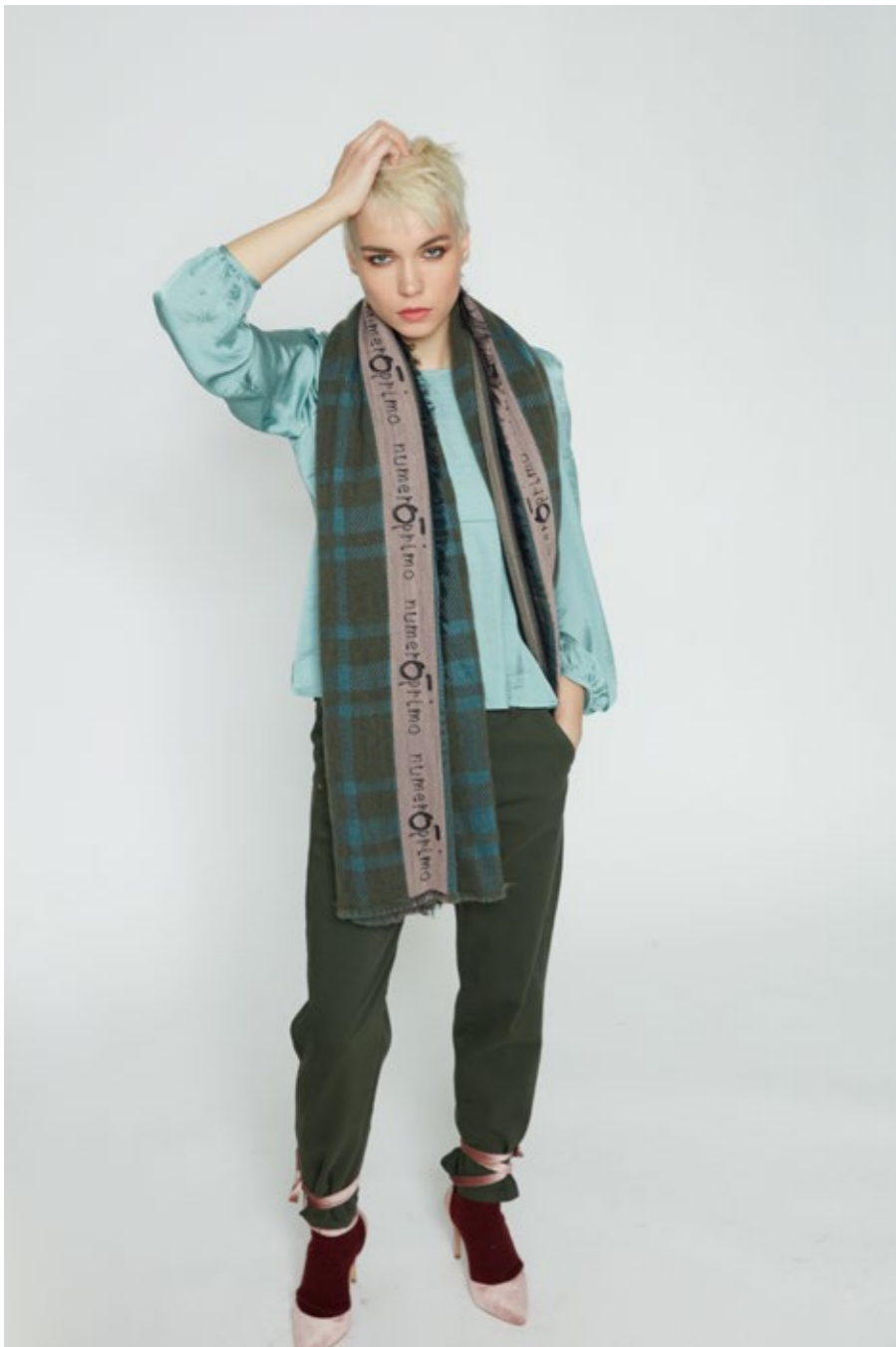
Camicia: NW503U Pantalone: NW312J Sciarpa: NW700P