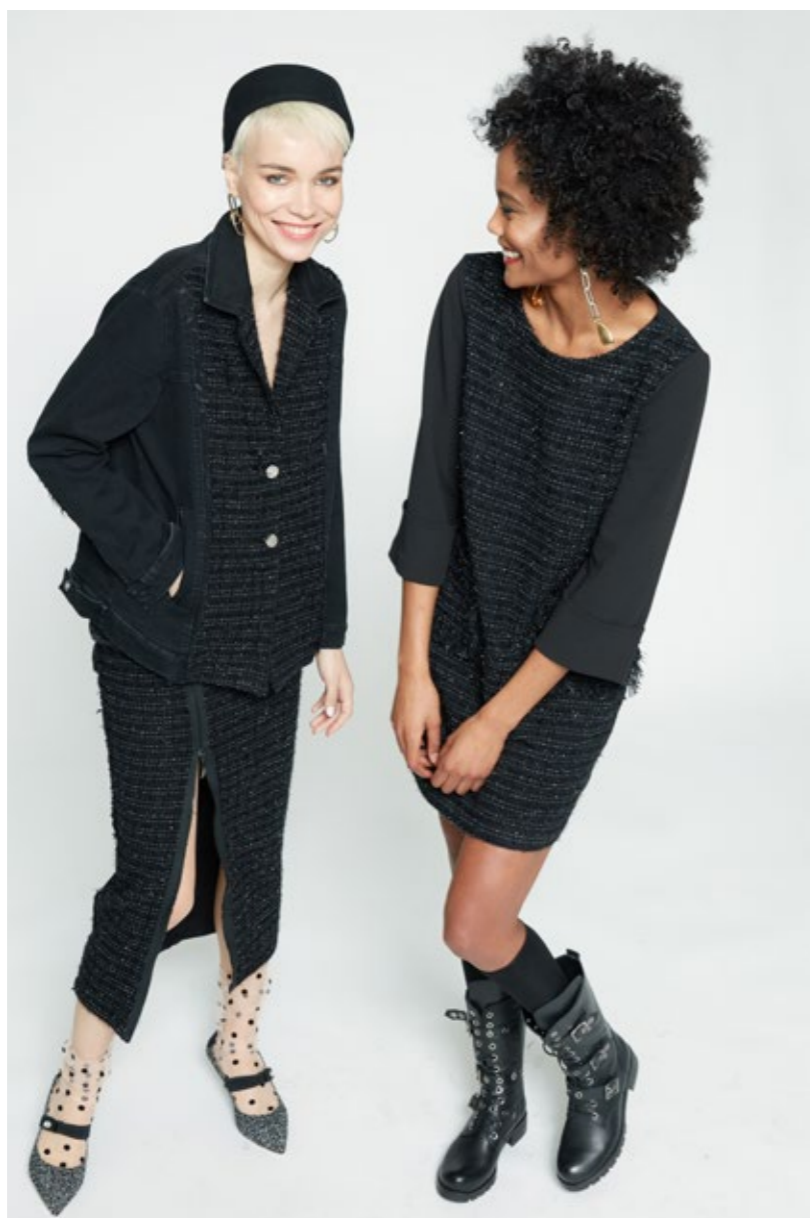
Abito: NW617C Giacca: NW200J Gonna: NW400J