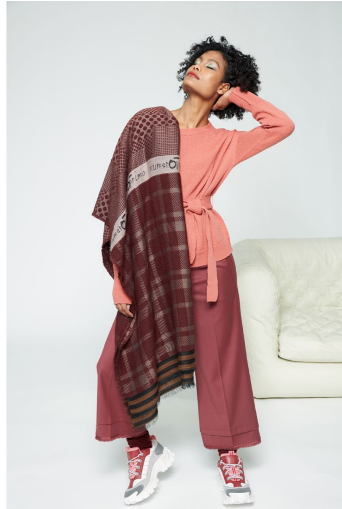
Maglia: NW112B Pantalone: NW317C Sciarpa : NW700P