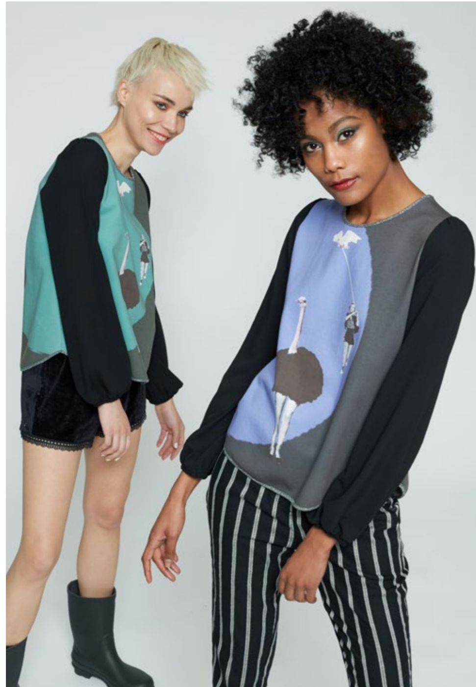
Maglia: NW121M Pantalone: NW321C