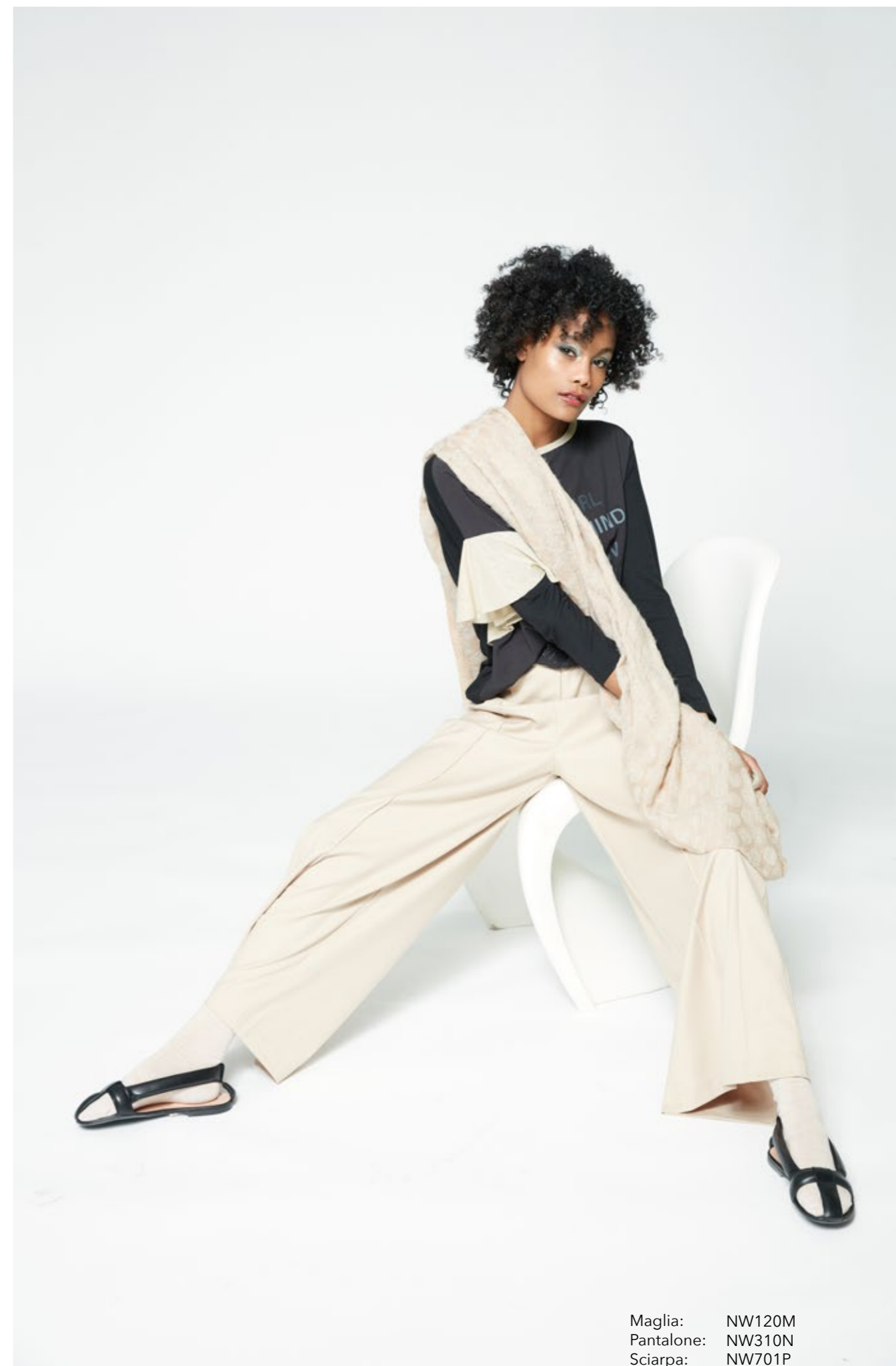
Maglia: NW120M Pantalone: NW310N Sciarpa: NW701P