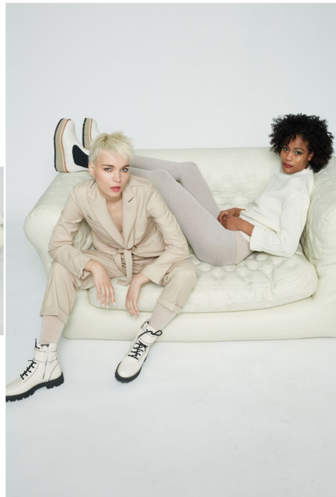
Giacca: NW202N Pantalone: NW309N Maglia: NW111B