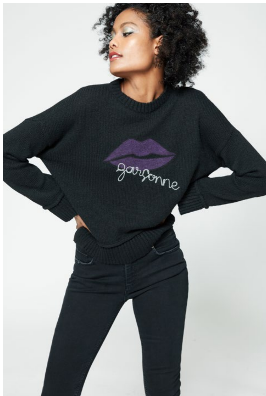
Maglia: NW103V Jeans: NW313J