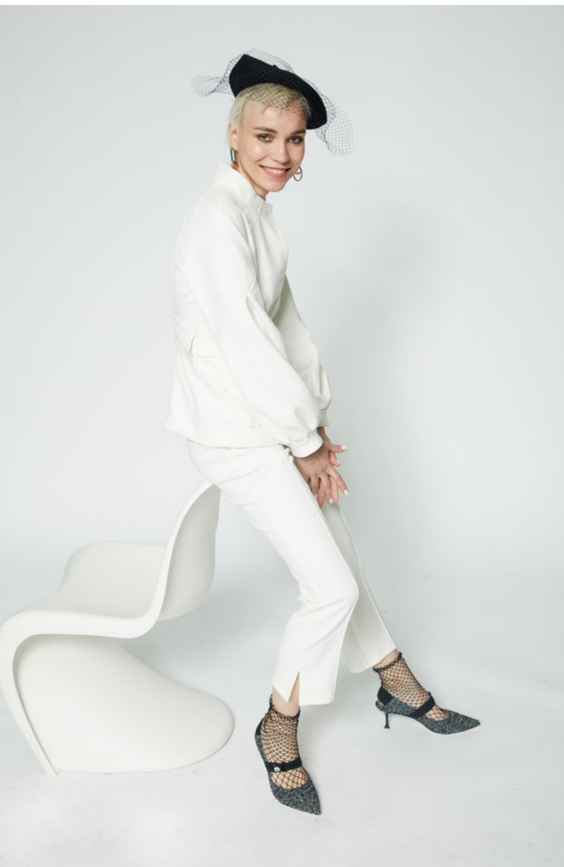
Giacca: NW205N Pantalone: NW311N